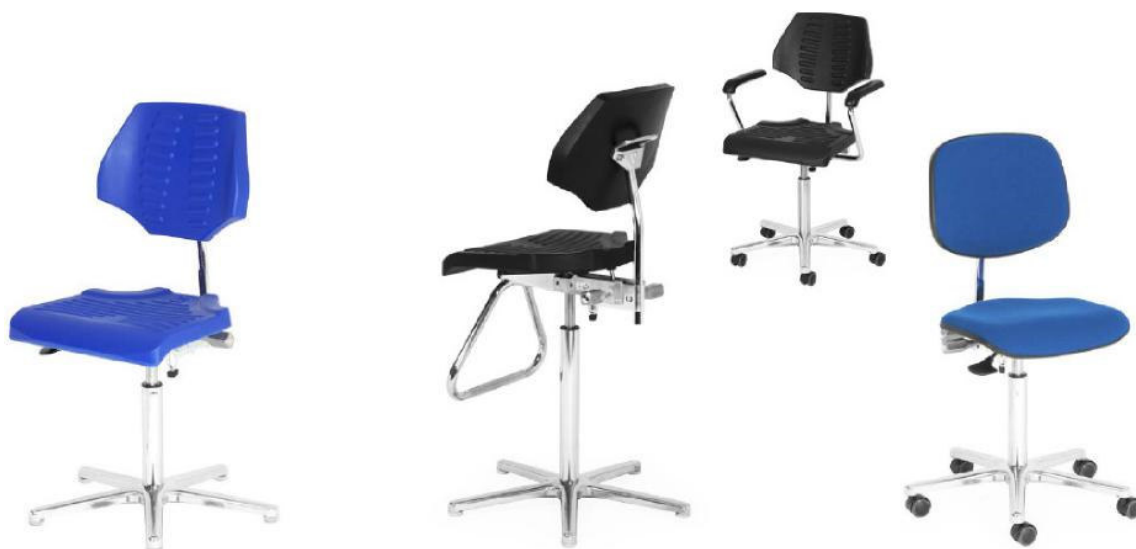
profiline P ST6 NH FK-R

Eine Weiterentwicklung des basic ist die Modellreihe des profiline mit einer etwas höhere Rückenlehne und einen flacheren Sitzeinstieg. Durch die abgerundete Sitzkante vorn rollen Ihre Oberschenkel besser ab und Sie können leichter aufstehen und hinsetzen. Zusätzlich gibt es für den profiline verschiedene Armlehnen sowie Aufstiegshilfen für höhere Arbeitsplätze. Für Laborstühle sind Sitzgarnituren mit PU-Schaum und Kunstleder geeignet und für Reinraumstühle nur Kunstleder.